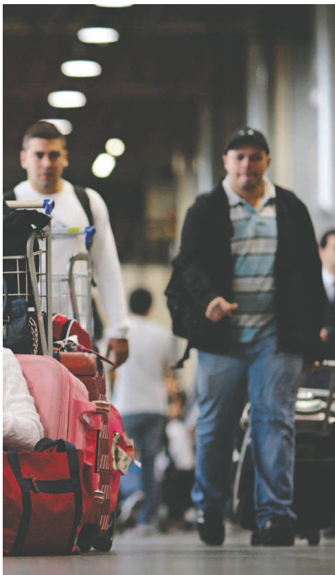
Всяко поотгелно е всекидневие